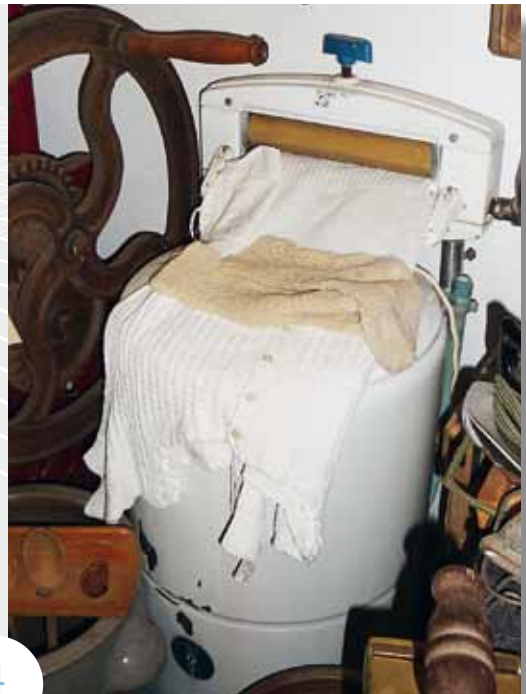
Vaste prik: maandag wasdag.

Voor onze moeder was het huishouden een echte dagtaak. Er waren weinig machines om haar taken te verlichten. De luiervas werd in een grote ketel voorgerekookt. Het liefst op zondagavond, want dat scheelde voor maandag.