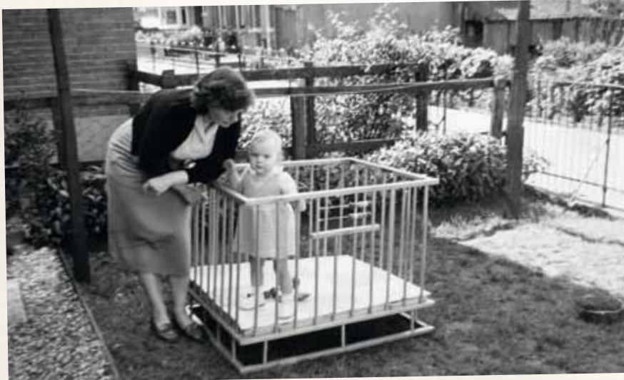
Een onderonsje met mama, in de buitenlucht.