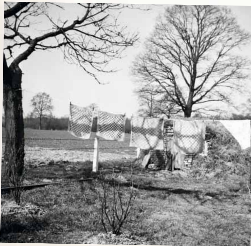
De was wappert droog in de wind.

Op maandagochtend scheidde moeder de bonte en witte was van elkaar. Daarna zette ze de machine aan en hevelde de was over. Die draaide ze daarna op een wringer, die op de machine was gemonteerd.