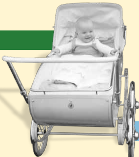
Een kinderwagen, model 1955.

Geluk was nog heel gewoon. Voor de volwassenen was het leven begrijpelijk en duidelijk, maar daardoor soms ook benauwend. Een tijd waarin ze de handen