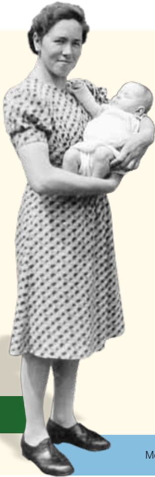
Moeder en baby gekiekt op eigen erf.