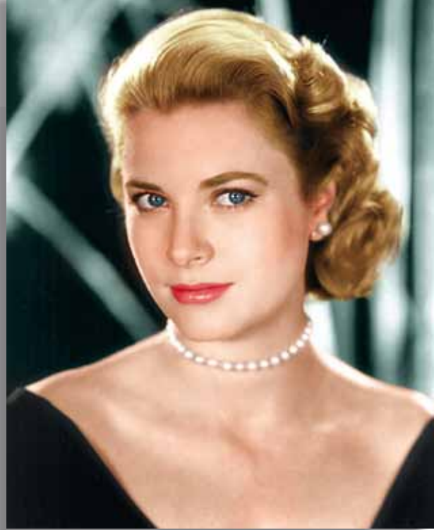
Grace Kelly, een prachtige vrouw.

Op 13 september 1982 sloeg het noodlot toe. Grace en haar dochter