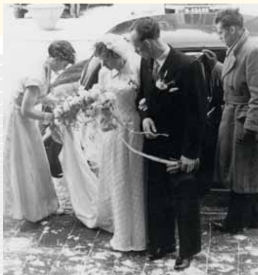
Zomaar een huwelijk, midden jaren 50.

Onze moeders waren thuis om het huishouden te doen, dus we hoefden niet af te spreken om bij elkaar te kunnen spelen. Een heerlijke peutertijd, veilig en onbezorgd.