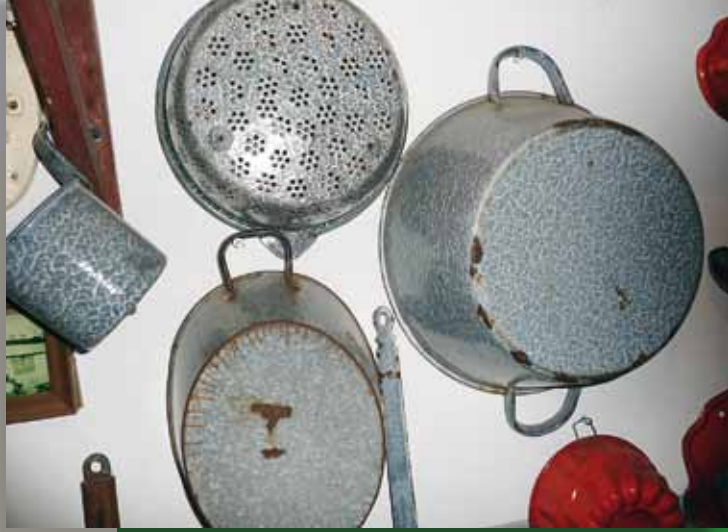
Praktisch: potten en pannen van emaille.

in de teil gegoten, die voor de warme kachel stond. Dat betekende ekker plonzen met het water, en vaak gingen meerdere kinderen in hetzelfde badwater. De huizen werden verwarmd door kolenkachels en water werd op het gas gekookt om het te verwarmen voor de (af)was en het bad.