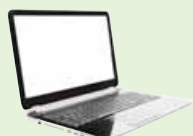
un ordinateur (portable)