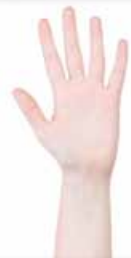
Au revoir !