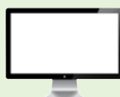
un écran plat